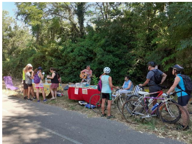
La bibliothèque pour l'animation « Partir en Livre » sur la voie verte

La bibliothèque F. J. Temple d'Aujargues est un service municipal gratuit pour le public, et fait partie du réseau des médiathèques et bibliothèques de la Communauté de Communes du Pays de Sommières. La carte de lecteur est donc commune, utilisable dans tout le réseau.