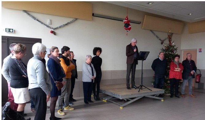
Vœux du maire, dimanche 15 janvier, dans la salle du foyer