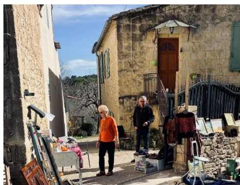
Vide grenier, dimanche 12 mars