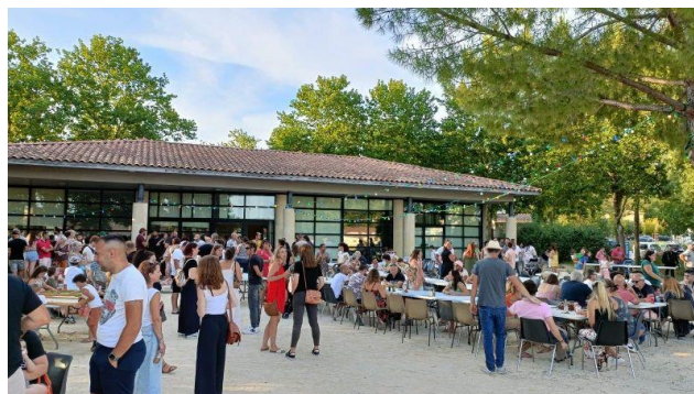
La fête des écoles Aujargues Junas au foyer de Junas