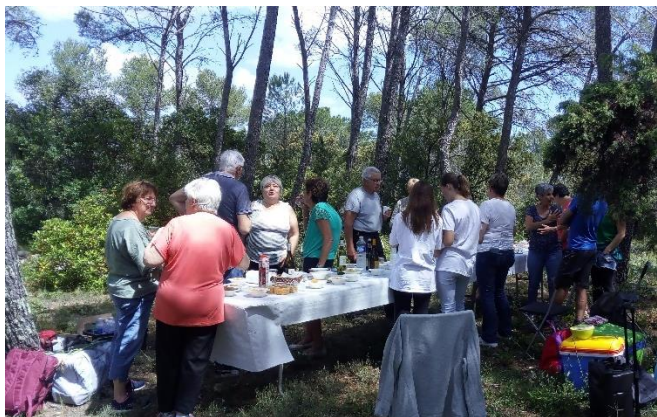
Journée Nature au Puech Reboul organisée par le CCAS