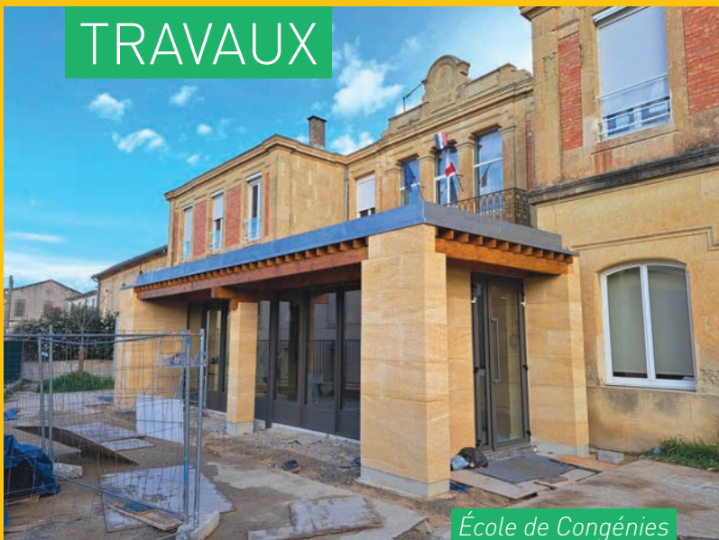
École de Congénies