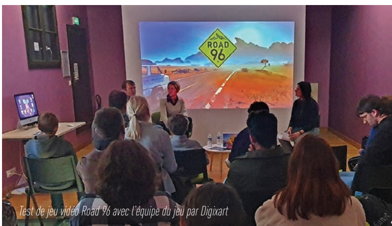
Test de jeu vidéo Road 96 avec l'équipe du jeu par Digixart

Ce stage, entièrement financé par l'Education Nationale, et dans le cadre de la Convention de Généralisation de l'Education Artistique et Culturelle (CGEAC) a permis aux choristes de tout niveau d'approfondir leur technique vocale personnelle et de développer des techniques de direction transposables aux situations d'enseignement au bénéfice du développement des pratiques chorales scolaires. Au-delà de ce projet artistique, ce week-end a été également un lieu d'échanges entre des personnels d'horizon divers venant de toute l'Occitanie.