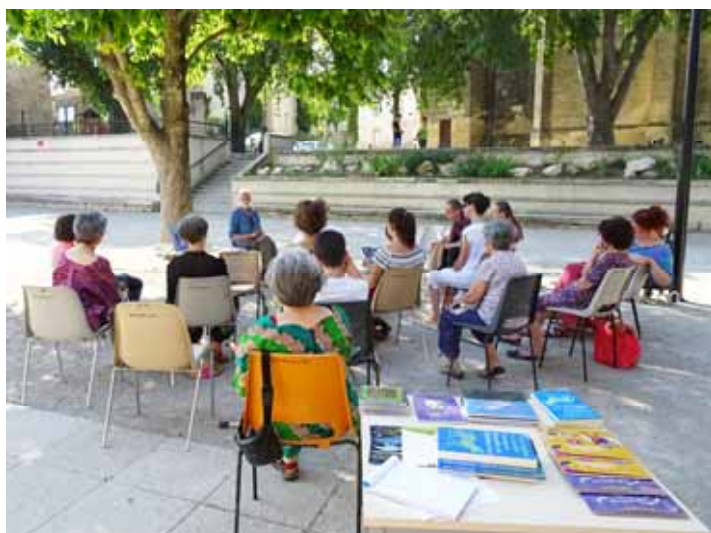
Rencontre avec un conteur

Inscription et prêt gratuits sur tout le réseau