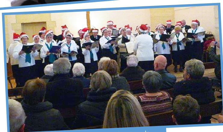
Chants de Noël au temple 21 décembre 2014 Association Auj'Arts'gues