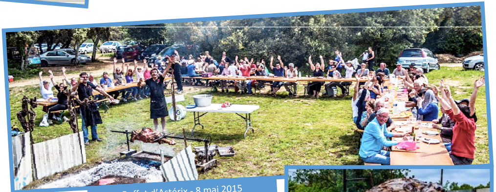
Buffet d'Astérix - 8 mai 2015 AJA