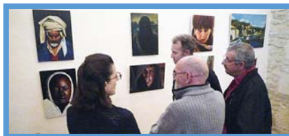
Exposition de Peinture au Temple 23 novembre 2014 Association Auj'Arts'gues