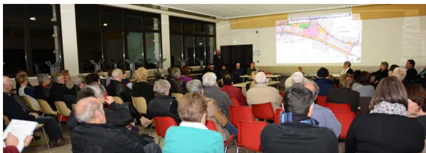
Réunion publique du 6 mars 2015

Nous l'avons ensuite présenté à l'ensemble de la population lors de notre première réunion publique du 6 mars dernier. ■