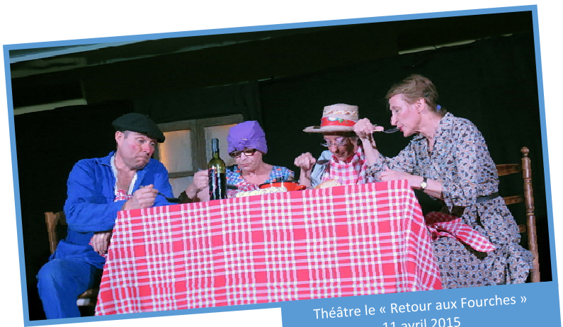
Théâtre le « Retour aux Fourches » 11 avril 2015