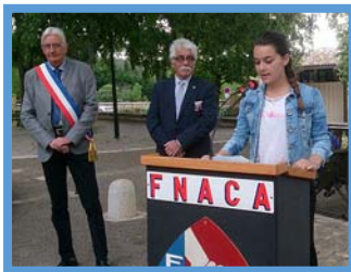
Souvenir du 8 mai