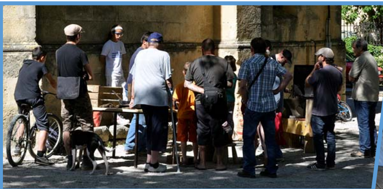
Métiers d'Arts et Savoir-Faire 17 mai 2015