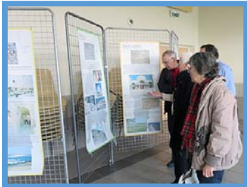
Expo-conférence « La Régordane » 7 février 2015