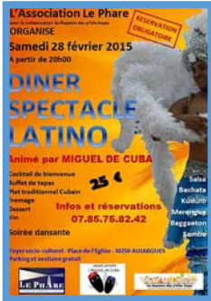
Soirée cubaine 28 février 2015 Association Le Phare