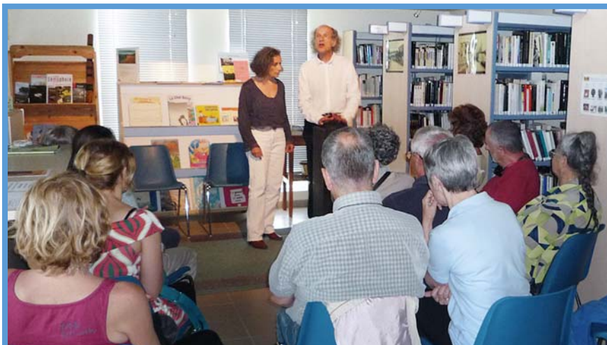
Pour qui danse la mouche - Réseau des bibliothèques - 29 mai 2015