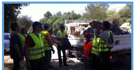
Nettoyage de Printemps 30 mai 2015