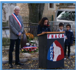
Souvenir du 11 novembre

V oici un extrait de ce qui s'est passé à Aujargues durant les six derniers mois. Pour animer notre village, il y a les évènements organisés par la Mairie mais aussi les actions menées par les Associations Aujarguaises de plus en plus actives. Que l'agenda du second semestre 2015 soit aussi rempli que celui du premier !